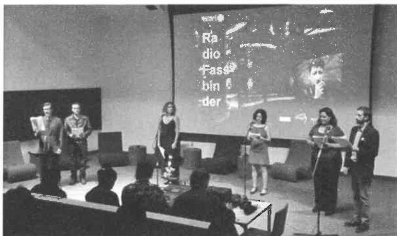
Alistan transmisiones de Radio Fassbinder en la frecuencia de Radio Educación

Se trata de una serie de radioteatro que presentará por primera vez en español las obras para radio del prolífico cineasta alemán